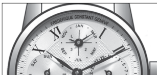
年份指针对应查询表