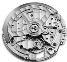
Jaeger-LeCoultre 积家 899AC 型机芯