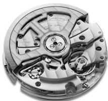
Jaeger-LeCoultre 积家 751型机芯